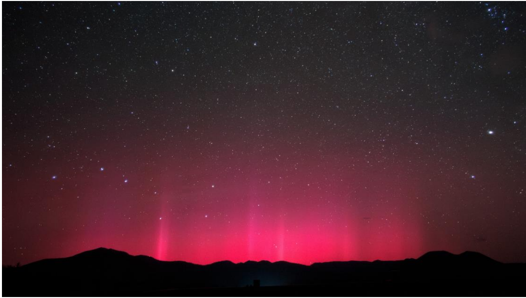
画像 2 : 遠軽町の上空に現れた赤いオーロラ

太陽プロトン現象自体が直接オーロラを引き起こすわけではありません。しかし、オーロラを引き起こす宇宙天気現象に付随してしばしば発生するため、オーロラの記録は、研究者が調査すべき年代を絞り込む手掛かりとなります。研究チームが、青森県北部で発掘されたアスナロの年輪の炭素 14 含有量を測定したところ、大規模な太陽プロトン現象が発生したことを示唆する急激な増加が確認されました。最大級のものと比較すると小さいものの、人類が直接観測した中で最も大きかった 1956 年 2 月のプロトン現象より 10 倍以上大きなものでした。年輪年代学 (地域の気候に関連した年輪成長パターンの比較に基づく年代決定法) と組み合わせると、この事象が西暦 1200 年の冬から 1201 年の春までの間に起こっていたことが分かりました。ちょうど、中国で赤い低緯度オーロラが観測されたのと同じタイミングでした。