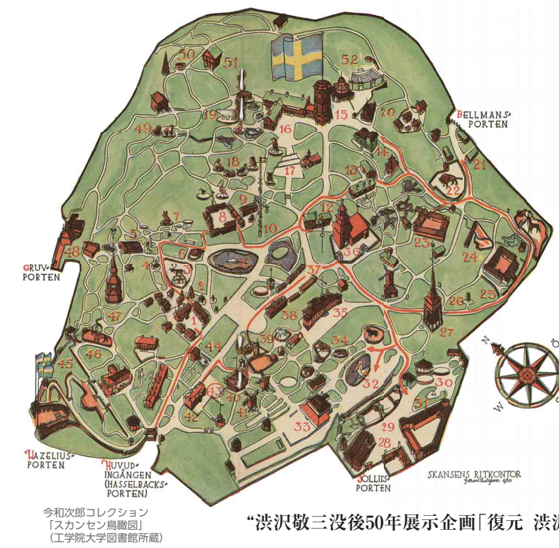
今和次郎コレクション「スカンセン鳥籠図」(工学院大学図書館所蔵)