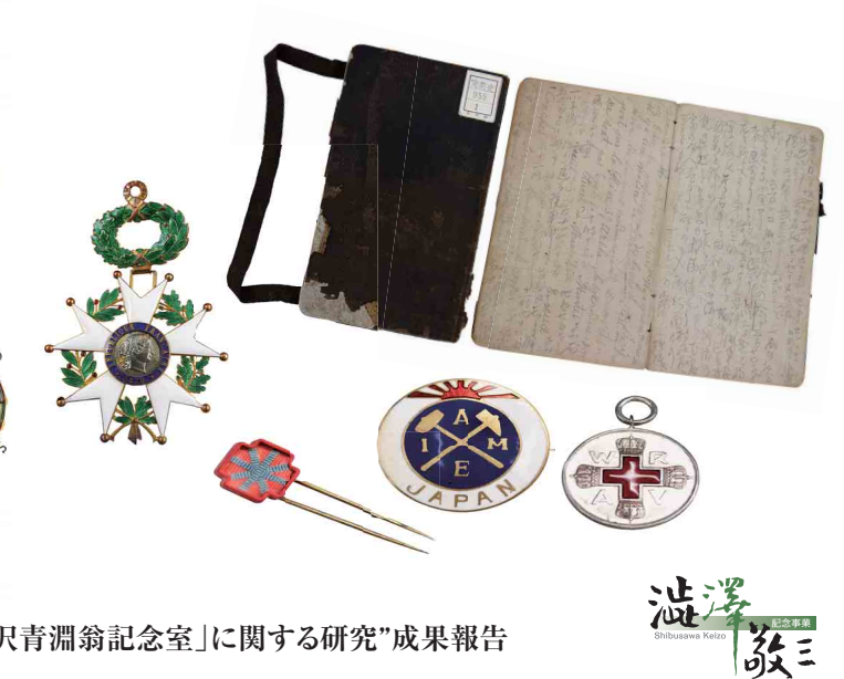
“渋沢敬三没後50年展示企画「復元 渋沢青淵翁記念室」に関する研究”成果報告