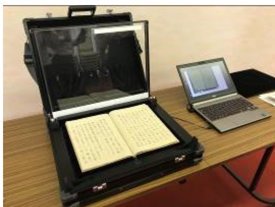
可搬型ブックスキャナ（試作機）

バッテリーを内蔵した可搬型ケースに組み込まれているため、寺社や個人宅など、古典籍の所有者の現場にスキャナとPCを持ち込むだけで、容易に電子化作業を実施できます。また、オーバーヘッド（頭上）でスキャンする方式を採用しているため、フラットベッド式のスキャナを利用する場合と比較し、古典籍へのダメージを最小限に抑えることができます。古典籍の撮影などでも書籍に優しく簡単な操作で電子化を実現できます。