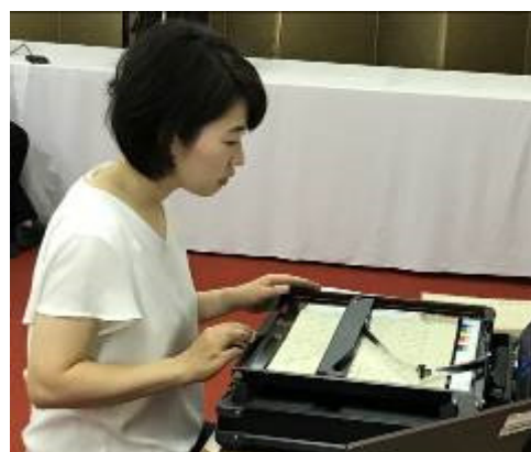
電子化作業の風景