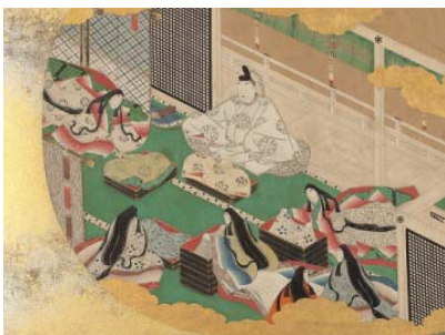
『源氏物語団扇画帖』

『源氏物語』『徒然草』ほか、一度は耳にしたことがある日本古典の名作を一挙に公開します。たとえば小・中・高校の教育用教材や、年賀状の作成などにも自由に活用していただけます。