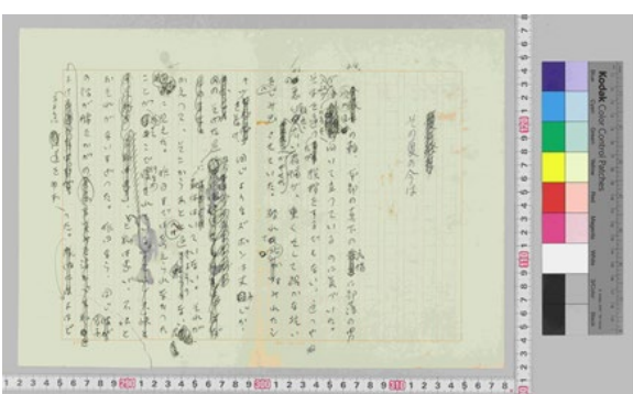
(原稿 1 枚目)

https://school.nijl.ac.jp/kindai/KSKB/KSKB-00049.html