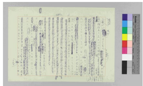
(原稿 2 枚目)