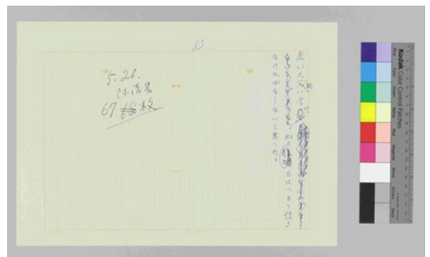
(原稿 83 枚目)