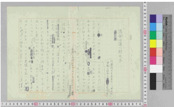
(原稿 1 枚目)

https://school.nijl.ac.jp/kindai/KSKB/KSKB-00050.html