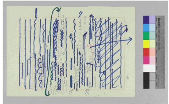
(原稿 7 枚目)